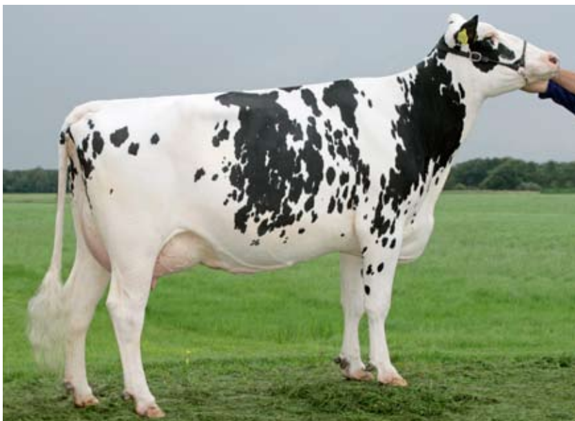
Delta Aranka ( AV 85) 2.05 305 8979 4.23 3,51 v. Shottle Succesvol Deltadonor

Aan het einde van het afgelopen boekjaar is begonnen met het systematisch typeren van potentiële stiermoeders. Uit koeien met positieve merkers kunnen dan embryo's aangekocht worden die men vervolgens als InSire-embryo in pakketvorm te koop aanbiedt. Door deze nieuwe manier van selecteren is de structuur van het fokprogramma grondig gewijzigd. Vrouwelijke dieren waarvan geen merkers bekend zijn kunnen nog steeds in aanmerking komen voor het fokprogramma, mits hun nakomelingen dan op genetische merkers onderzocht worden. Bij deze wijziging is er ook een vernieuwing van de con-