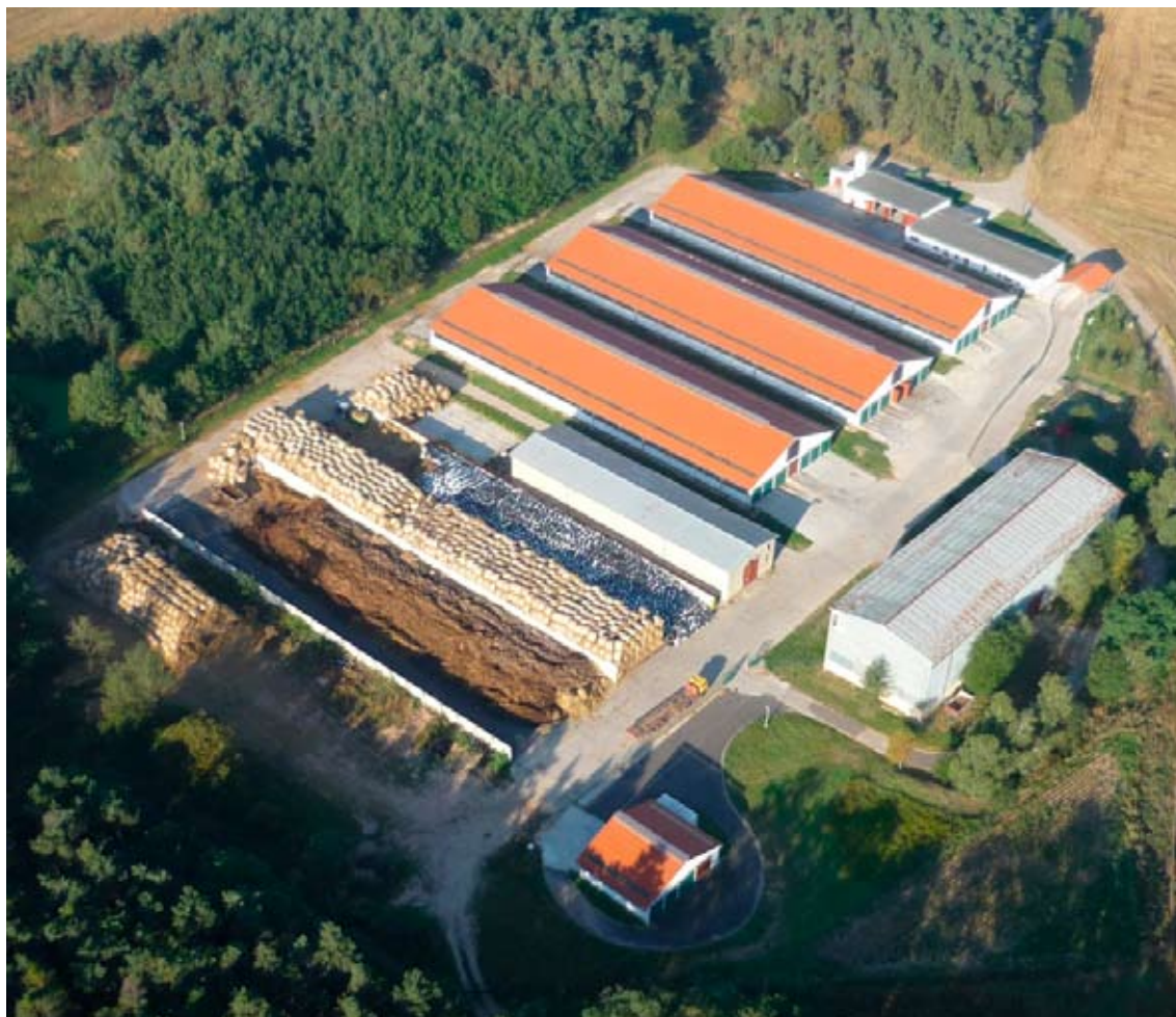
In 2007 werden in het Tsjechische Valov nieuwe stallen gebouwd voor wachtstieren

CRV Tsjechië heeft bovendien besloten tot uitbreiding van het fleckviehfokprogramma en dat leidde tot een nauwe samenwerking met de Duitse KI Besamungsverein Neustadt (BVN). Deze samenwerking startte met het gezamenlijk testen van Duitse stieren in Tsjechië en de aankoop van veelbelovende jonge stieren in Duitsland. Alle stieren worden vervolgens door CRV Tsjechië getest. Dit zal enerzijds een bijdrage leveren aan de verschillende behoeften van de Tsjechische veehouders en anderzijds aan het gevarieerde aanbod van fleckviehstieren aan veehouders wereldwijd.