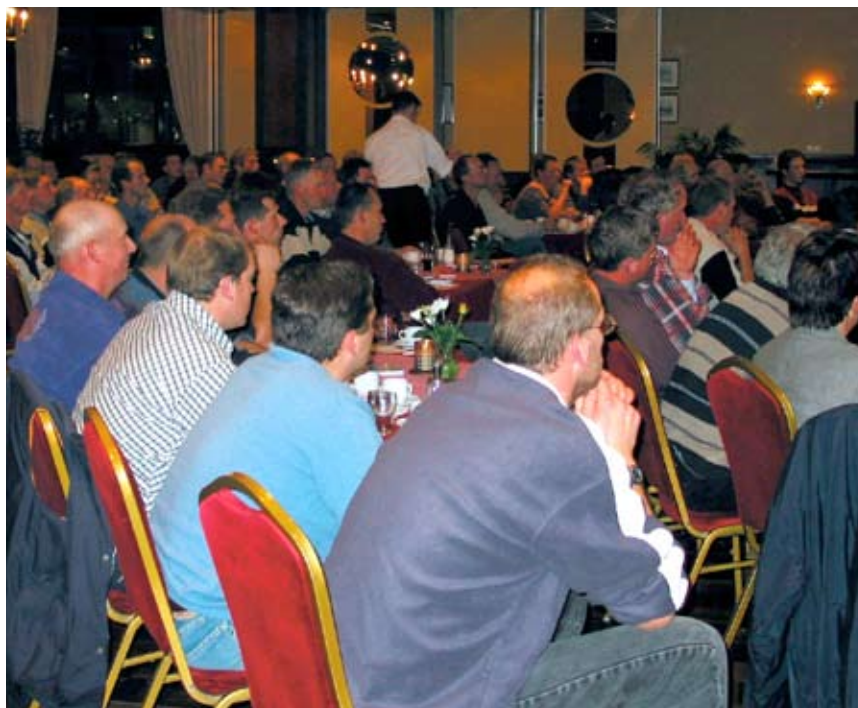
De ledenbijeenkomsten 2008 werden 'ouderwets' goed bezocht. Het aantal bezoekers verdubbelde ten opzichte van de ledenbijeenkomsten van 2007

Afgelopen boekjaar is de samenwerking tussen CR Delta u.a. en VRV vzw intenser geworden. Uit kosten- en efficiëntieoogpunt is er hard gewerkt aan een goede, praktische synchronisatie tussen beide coöperaties. De leden- en voorlichtingsavonden zijn bijna gelijktijdig gehouden en ook de vergaderingen in het bestuurlijke circuit werden verder op elkaar afgestemd.