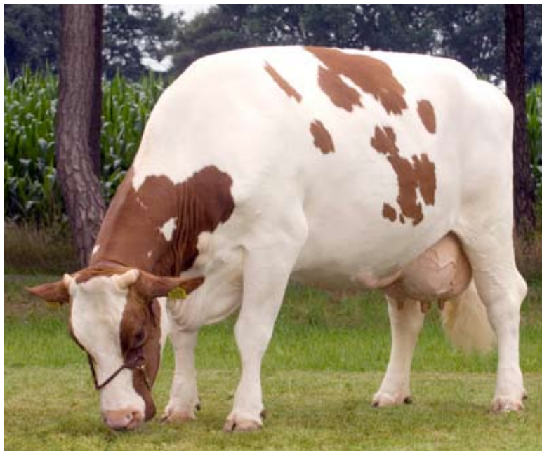
Manuel 214-dochter Susan 394 Fig. G.M. van de Heyden, Oost-West Middelbeers

Dat mag bij roodbont zeker ook gezegd worden van levensduur- en exterieurtopper HS Twister die samen met Welberger Sonlight een fraai debuut maakte op de stierenkaart. Een andere roodbonte nieuwkomer, Huyben's Red Tequila, maakte zijn faam als beste Faberzoon volledig waar op de NRM met een