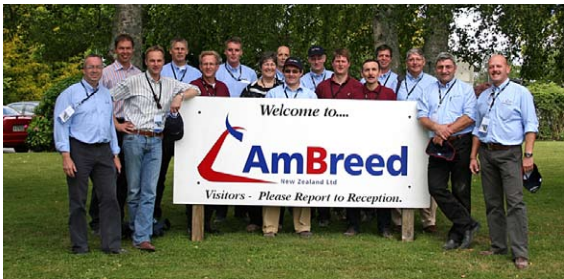
De Raad van Commissarissen bracht in december 2007 een bezoek aan CRV AmBreed

AmBreed was de eerste die gesekst sperma van in Nieuw-Zeeland gefokte en geteste stieren introduceerde. Vier stieren verhuisden voor de productie van gesekst sperma naar de Verenigde Staten. Ook werden de zogenoemde InSire-pakketten geïntroduceerd. In deze pakketten zitten stieren met een fokwaarde gebaseerd op genetische merkerinformatie. De verwachtingen van zowel het SiryX- gesekste sperma als InSire-merkerselectie zijn hooggespannen. Beide introducties verliepen succesvol en werden door de melkveehouders goed ontvangen. In 2009 veranderde de naam van AmBreed in CRV AmBreed.