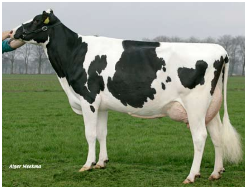
Surprisedochter Adrie 38 Eig. mts. Knoef-Hendrik- sen, Geesteren

Ten behoeve van het InSire-programma is met name op het eind van het boekjaar extra veel sperma van jonge stieren geproduceerd. Ook op de ET/IVP-labs zijn de werkzaamheden aanzienlijk uitgebreid. In september 2008 startte CRV namelijk met de vermarkting van InSire-embryo's. Tevens is het aantal OPU-sessies bij de veehouder het afgelopen jaar ruim verdubbeld. In totaal werden ruim 4900 embryo's verwerkt of geproduceerd op de embryolabs. De CRV-labs typeerden voor het fokprogramma in Nieuw-Zeeland 375 embryo's op sekse. De mannelijke embryo's werden daarbij geëxporteerd en ingeplant in Nieuw-Zeelandse ontvangsterkoeien,