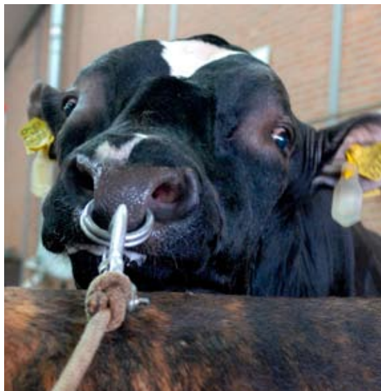
Himster Grandprix passeerde de grens van één miljoen doses sperma