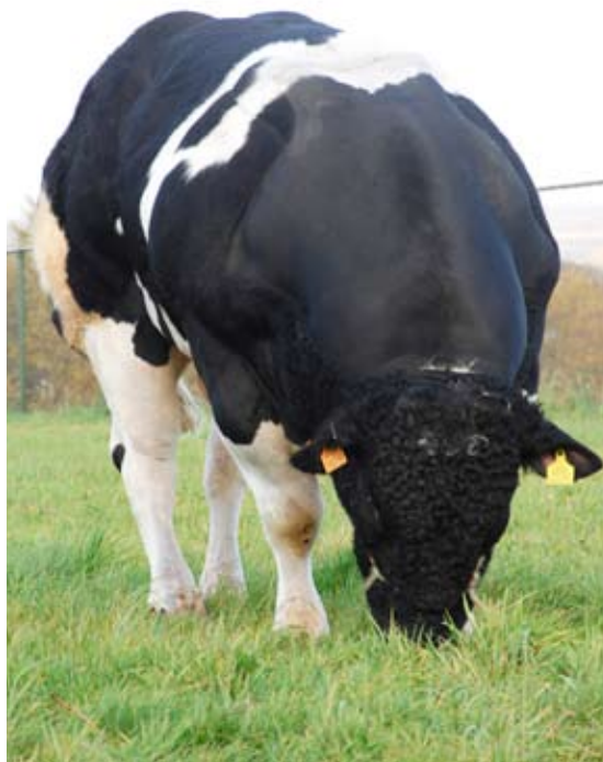
De uit Engeland afkomstige Belgisch witblauwe Blackstar werd in het voorjaar van 2008 ingezet als proefstier

Met het actuele en het aankomende stierenaanbod bewijst BBG dat ze hard werkt om aan de eisen van alle veehouders te voldoen.