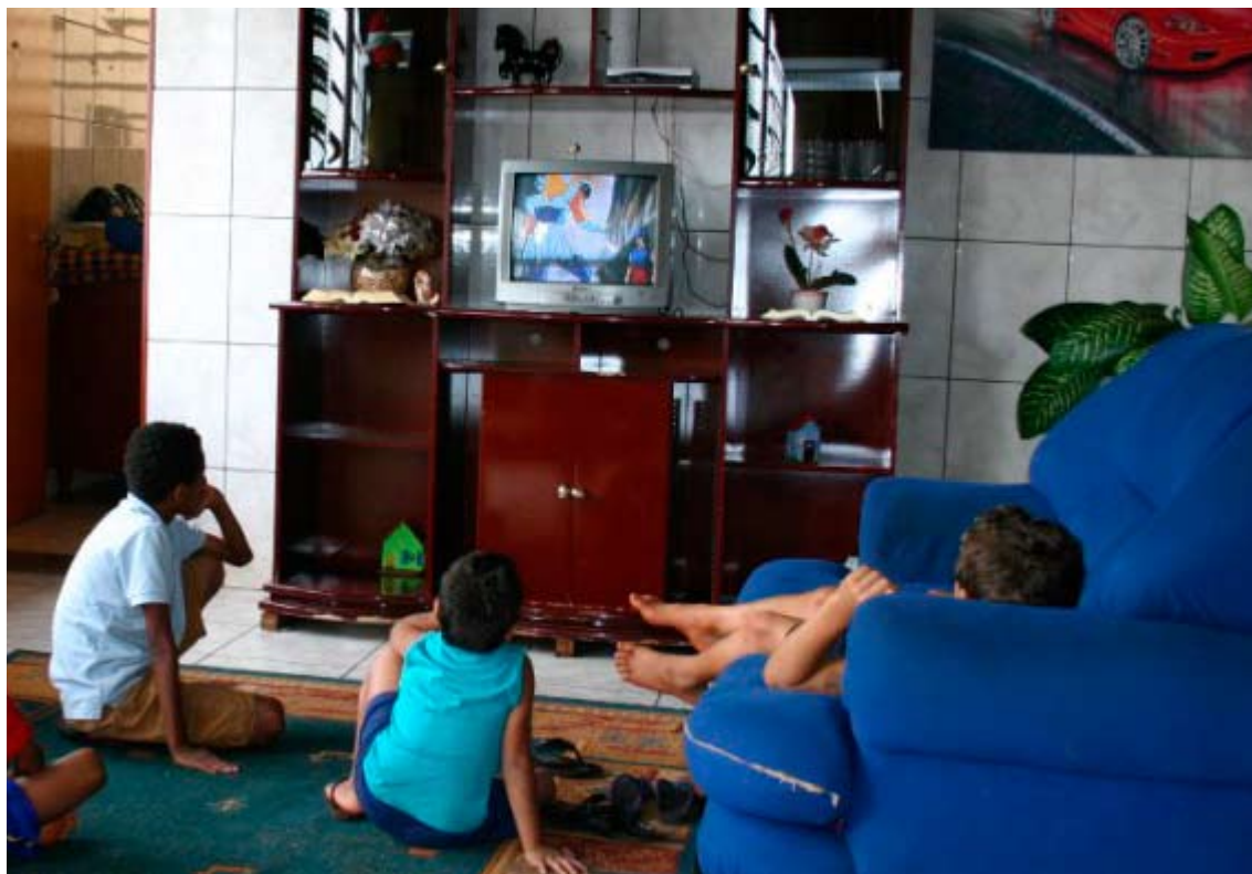
Jaarlijks wordt het weeshuis 'Lardos Meminos', direct gelegen naast onze vestiging in Brazilië (CRV Lagoa), door CRV financieel ondersteund

CRV wil 'veilig werken' stimuleren en heeft daarin diverse initiatieven genomen, zoals de vernieuwing van het handboek 'Veilig werken met stikstof' en het in kaart brengen van verbeteringen met betrekking tot de vluchtwegen voor stierverzorgers van alle stierlocaties. Daarnaast zijn er arbohandboeken op de laboratoria verschenen waarin ook milieugerelateerde thema's behandeld worden, zoals hoe de laboranten verantwoord om moeten gaan met gevaarlijke stoffen en afvalstromen in het laboratorium.